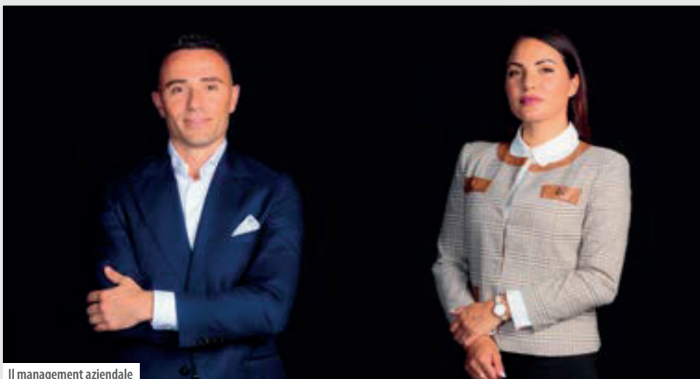
Il management aziendale

con estrema serenità quella che esce dal rubinetto di casa. Non un'immaginazione ma pura realtà, "pura" come l'acqua che si ottiene grazie agli impianti Aquamea. Con tecnologie all'avanguardia, l'azienda garantisce di portare ogni giorno acqua pura nelle case, oppure nelle città, mediante cassette dell'acqua o, ancora, in scuole, uffici, aziende attraverso colonne per l'erogazione. Parlare di semplici impianti è riduttivo. Pensiamo a quello per uso domestico. I clienti possono scegliere non solo il tipo di acqua ma anche come berla: dalla classica a temperatura ambiente alla fredda, dalla frizzante alla liscia, ma anche più o meno ricca di minerali.